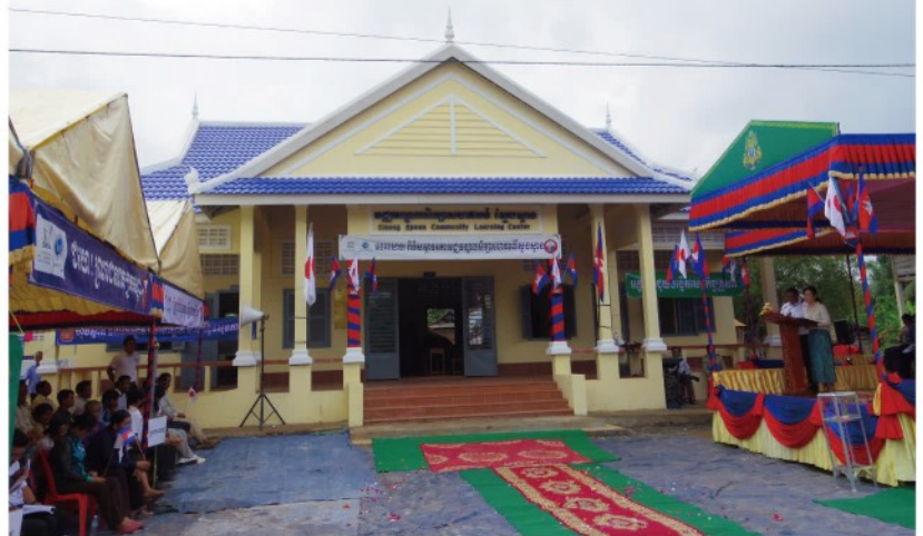
カンボジアの寺子屋