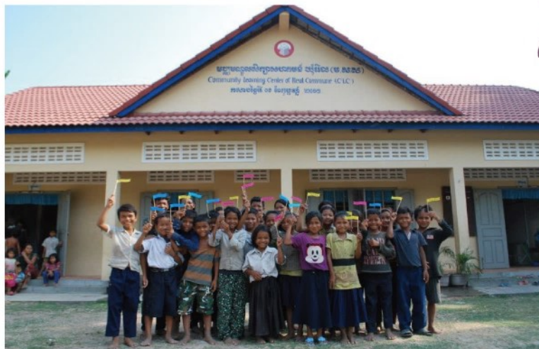
カンボジアの寺子屋