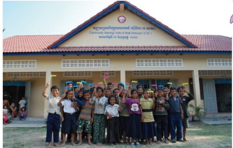
カンボジアの寺子屋