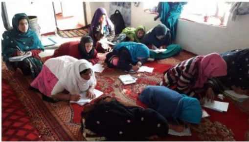
アフガニスタンの識字教室